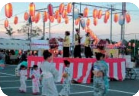
- にぎわう盆踊り -

今年は、かき氷早食い大会、よさこいソーランおどりなどの楽しいイベントがいっぱい。当日は、浴衣を着た親子連れ、友達同士など、大勢の皆さんが会場を訪れにぎやかな夜になりました。