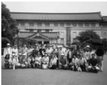
- 東京国立博物館前で -

7月24日(土)、上野の東京国立博物館に行き、多くの国宝を見学しました。本館は展示替中でしたが、法隆寺宝物館で私たちのために展示解説がありました。参加者41人。