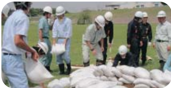
- 月輪工法を实践 -

8月7日(土)に長生郡市町村共同の水防訓練が一宮川第一調整池で行われました。これは、一宮川流域関係機関等(一宮川流域治水環境対策協議会、千葉県河川協議会長生支部、長生地域整備センター)の主催により行われたもので出水期を迎えるにあたり、水防技術の向上を図り水防の重要性の認識を高めることを目的としています。訓練では、土のう作りから始まり、積み土のう工法、月輪工法、表シート張り工法を学び有事への備えを整えました。