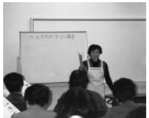
- 地域住民を対象とした健康づくり講座 -