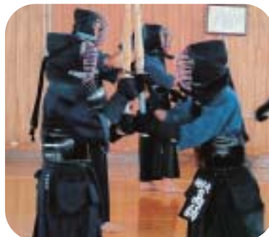
- さらなる目標へ向けて練習！ -