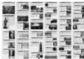
- 裏に文化財を掲載 -

を掲載しています。睦沢町の文化財を探访するために必要な方に、資料館窓口にて無償頒布いたします。