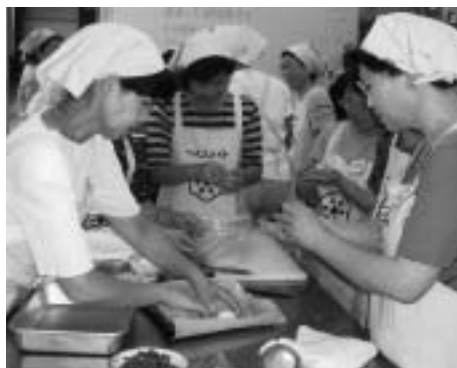
- 保健栄養推進員の研修会 -