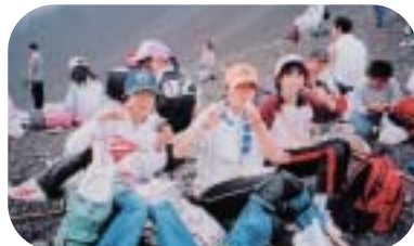
- 登山の途中で楽しいお昼 -