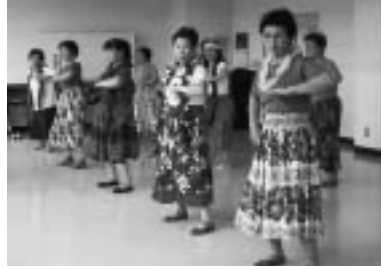
ワヒネ・フラ(A)(フラダンス)

軽快な音楽にのって、踊り出す。皆に合わせて、きもちよく指先から全身を動かすと、いくつかわ返ります。