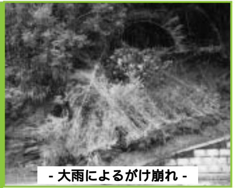
- 大雨によるがけ崩れ -

「災害は忘れたころにやってくる」とよくいわれるように、地震や火災などの災害は、いつおきるかわかりません。いざという時に困らないように、日ごろからの備えが大切です。