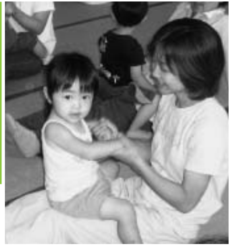
- 親子ふれあい教室 -