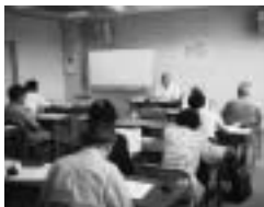
- 講演の様子 -