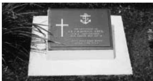
- 横浜の英連邦墓地にあるポーナス中尉の墓 -

報告書は英文で、タイトルに「英国軍飛行士ポーナス」とあり、概要として「1945年8月15日、ポーナス飛行士は千葉県長生郡土睦村上空で撃たれた。パラシュートが開かなかったことで亡くなった云々」とあり、近所の人がその遺体を発見したことが記されていた(続く)。 この事件を目撃したり、ご存知の方はお知らせください。 (資料館学芸員・久野一郎)