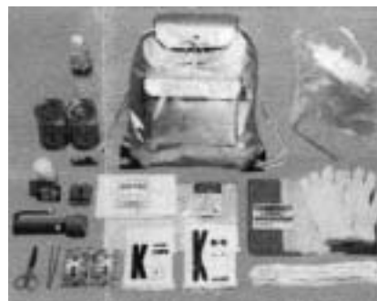
- 防災用品の備えを! -