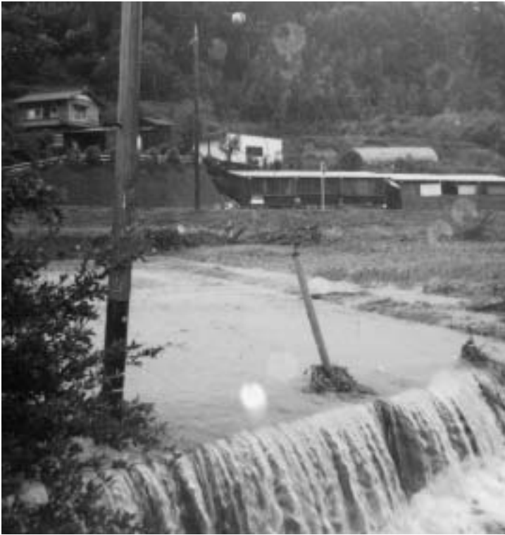
-平成8年 台風17号の大雨で崩壊した岬(妙楽寺)-

秋は台風が多く発生し、大きな被害をもたらします。台風や大雨は予測ができるからと油断は禁物です。今年は、予測が難しい突発的な大雨による被害が各地で発生しています。日頃から、お住いの地区で風水害の発生しやすい場所、特に河川・がけ付近に注意をはらうなど家の周りの安全対策を心がけましょう。 台風や大雨による被害の恐れがある場合には、注意報・警報が発表されますのでテレビ・ラジオの気象情報に十分注意してください。 町でも、大雨に対応するべく瑞沢川の排水機場の整備を進めたり、県の気象情報システムにより気象の変化に留意するなど災害を未然に防げるよう注意しています。