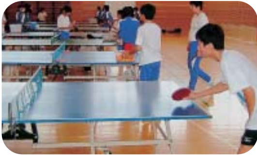
- 熱心な練習から好成績が！ -

はこの大会が中学校生活で最後の部活動となることから、下級生を指導しながら、自身も大きな目標を持って大会に臨みました。大会では、先輩、後輩一丸となり健闘し好成績を収めました。