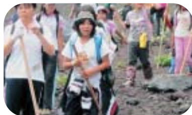
- 険しい道のりも友達と楽しく進みます -