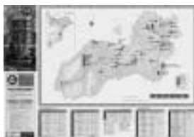
- 表の睦沢町全図 -

平成9年に刊行した旧版の改訂版。睦沢町にある国・県・町指定の文化財と未指定ながらもよく知られた文化財