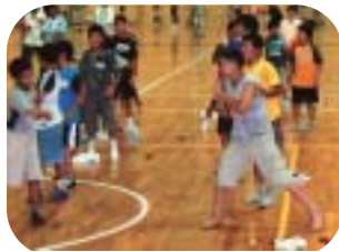
- みんなでよさこい踊り -

8月6日(金)～8日(日)に青少年連絡協議会主催による「青少年・自然体験合同キャンプ」が静岡県御殿場市の「国立青年の家」で行われました。瑞沢小学校、土睦小学校、睦沢中学校の生徒たちは最初、慣れない共同生活にとまどっていました。野外での自炊、夜にみんな一緒に踊ったよさこい、富士登山等の3日間のふれあいですっかり打ちとけ、夏の思い出をたくさん作れたようです。