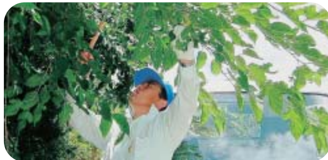
- 小枝切りの様子 -

8月5日(木)に睦沢町交通安全対策協議会による小枝切りが行われました。これは、町内各地区の道路にはみだしている枝、カーブミラーにかかっている枝を伐採し交通安全環境を整えることを目的としたものです。炎天下の中、約30人の参加者の皆さんの協力でダンブに何台ぶんもの枝を切り取り、危険箇所を改善することができました。また、小枝切り時にご協力いただきました町内各地区の皆さんありがとうございました。