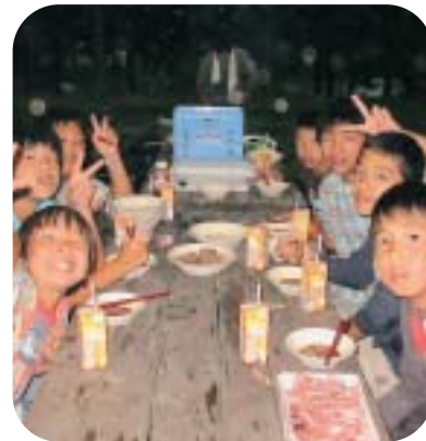
- みんなで食べる夕食は最高! -

8月6日(金)～8日(日)に青少年連絡協議会主催による「青少年・自然体験合同キャンプ」が静岡県御殿場市の「国立青年の家」で行われました。瑞沢小学校、土睦小学校、睦沢中学校の生徒たちは最初、慣れない共同生活にとまどっていました。野外での自炊、夜にみんな一緒に踊ったよさこい、富士登山等の3日間のふれあいですっかり打ちとけ、夏の思い出をたくさん作れたようです。