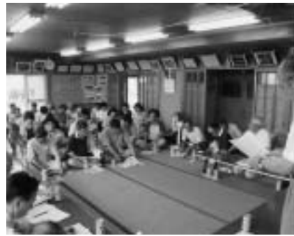
- 住民説明会の様子 -

町では、各地区からの要望により、7月3日(土)から7月25日(日)の間に、町内14の地区において12回の説明会(中間報告)を開催しました。猛暑の中、延べ322人の参加がありました。以下に説明会の概要をお知らせします。