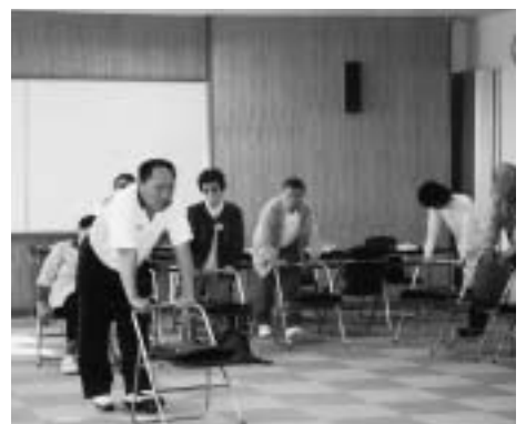
- いきいき教室（転倒予防運動）-