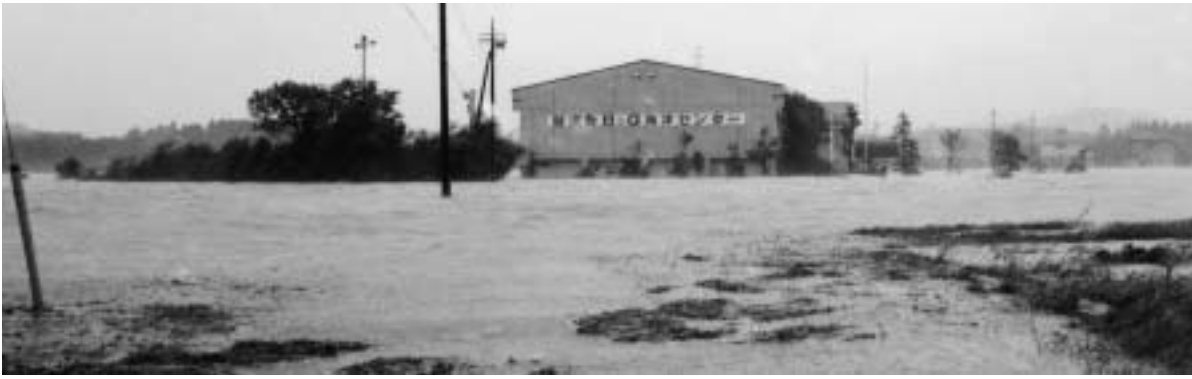
-平成8年 台風17号の大雨ではんらんした河川(大谷木)-