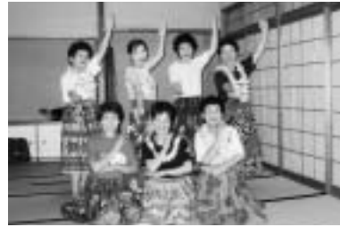
ワヒネ・フラ(B)(フラダンス)